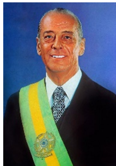
President João Figueiredo

De dodenlijsten, het resultaat van "Operatie Condor", waren in Brazilië relatief korter dan in de rest van de Zuidelijke Kegel van het continent, maar natuurlijk niet minder