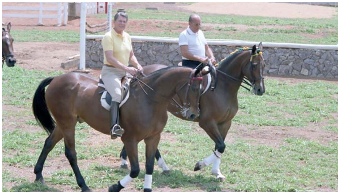
President Ronald Reagan van de Verenigde Staten (links) en President João Figueiredo van Brazilië. Deze foto is op 1 december 1982 in Brazilië gemaakt.

Het sleutelwoord hier is “Guiminish”: dat is de naam van het paard dat Figueiredo in November/December 1982 Reagan, bij zijn bezoek aan Brazilië, cadeau deed. De naam “Guiminish”, soms ook gespeld “Giminich” of “Giminish”, werd nu ook gebruikt voor de Amerikaans-Braziliaanse operatie in Suriname. De operatie werd strikt geheimgehouden