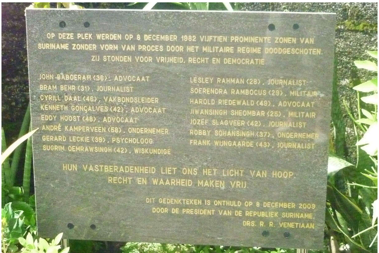
Monument op Fort Zeelandia met de namen van alle slachtoffers van de Decembermoorden.

Bij de beslissing om de hulp aan Suriname op te schorten in reactie op de Decembermoorden had de Nederlandse regering de clausule ingeroepen, met als argument dat “het behoud van de rechtsstaat een essentieel element vormde bij de sluiting van het verdrag”. 17 Mendes betwijfelde echter of aan de voorwaarden van de clausule was voldaan.