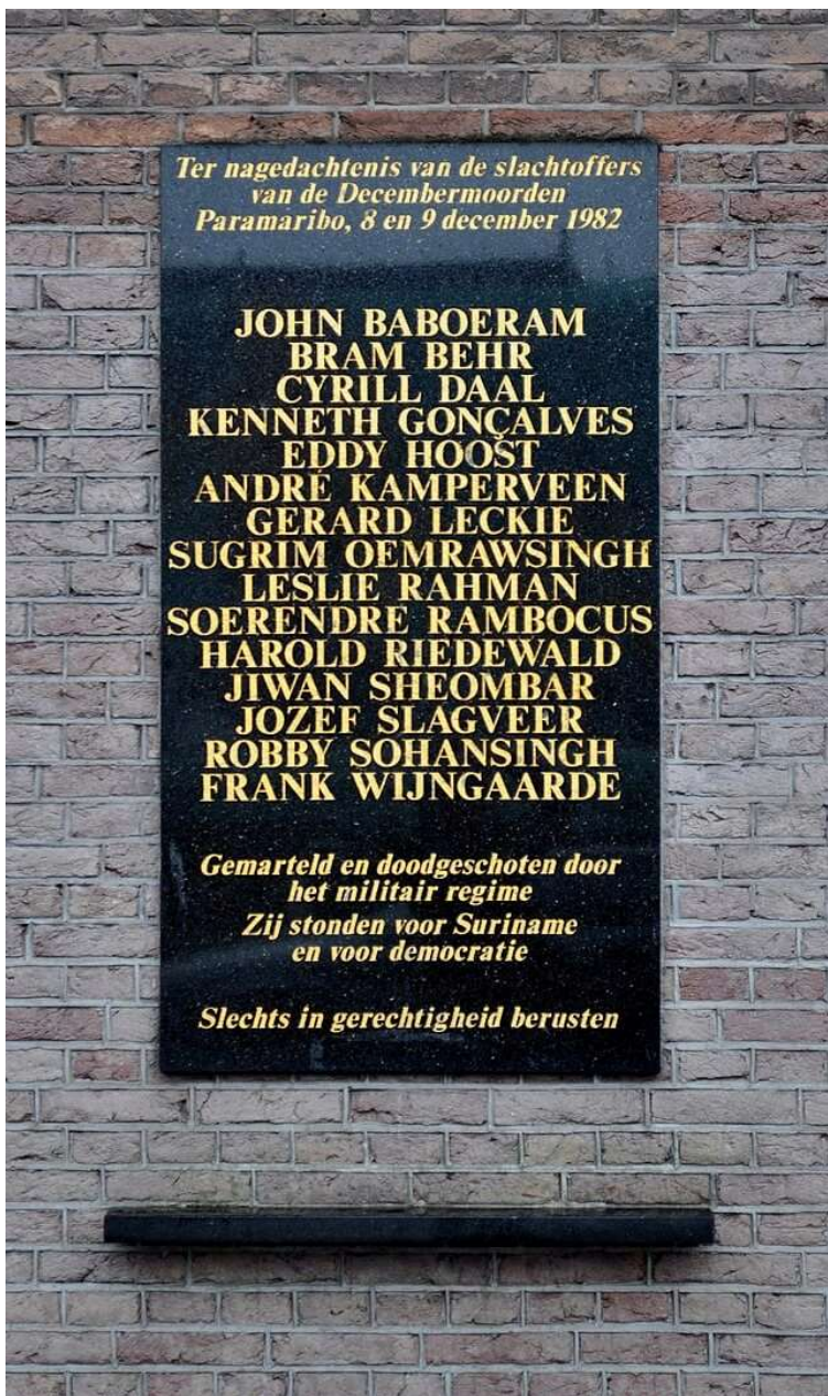
Plaquette aan de Mozes en Aäronkerk in Amsterdam.

Van 1982 tot 1988 is in de Tweede Kamer regelmatig over de criteria van het hervatten van de ontwikkelingshulp gedebatteerd. 22 In 1988 achtten de regering en het parlement van Nederland daarvoor voldoende redenen aanwezig. Er was een nieuwe grondwet tot stand gebracht, vrije verkiezingen hadden plaatsgevonden en op basis daarvan was een nieuwe - democratisch gelegitimeerde - regering gevormd.